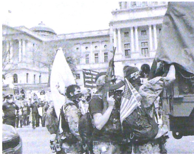
Ayer se recrudecieron las protestas en Pensilvania.

Y la situación tomó un nuevo impulso una vez que