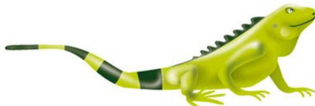
Logotipo de Ecopetrol

BOGOTÁ, Colombia , 20 de abril de 2020 / PRNewswire / - Ecopetrol SA (BVC: ECOPETROL ; NYSE: EC) (" Ecopetrol ") anunció la presentación de su informe anual bajo el Formulario 20-F para el año fiscal que finalizó el 31 de diciembre de 2019 con la Comisión de Bolsa y Valores de los Estados Unidos (la "SEC").