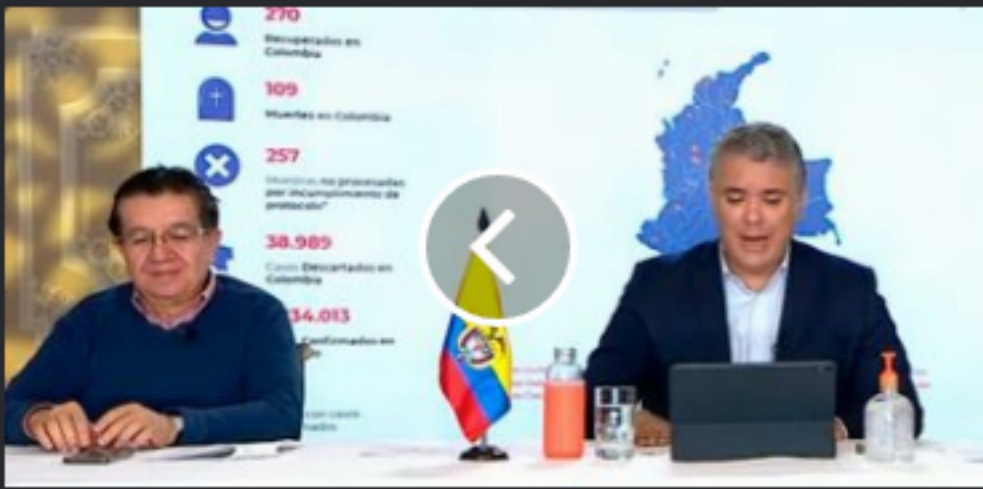
Presidente Duque anuncia decreto que busca fortalecer y acelerar los servicios de la telemedicina en el país