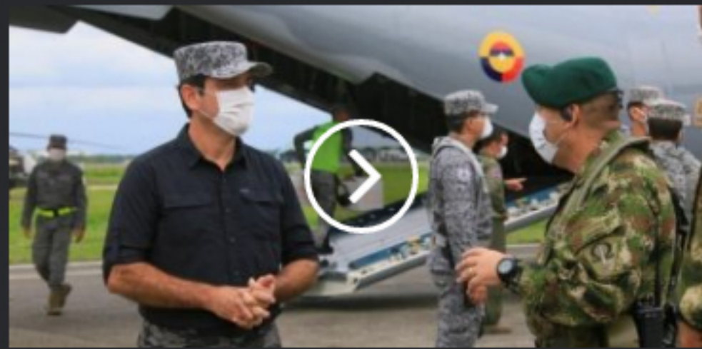
GOBERNACIÓN DEL META ENVIÓ 17 TONELADAS DE AYUDAS HUMANITARIAS Y MATERIAL MÉDICO A LA MACARENA