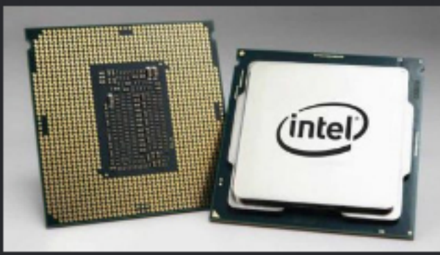
Intel está lista para reducir los precios de las CPU de escritorio ... ¿Aunque puede ser demasiado tarde para Comet Lake?