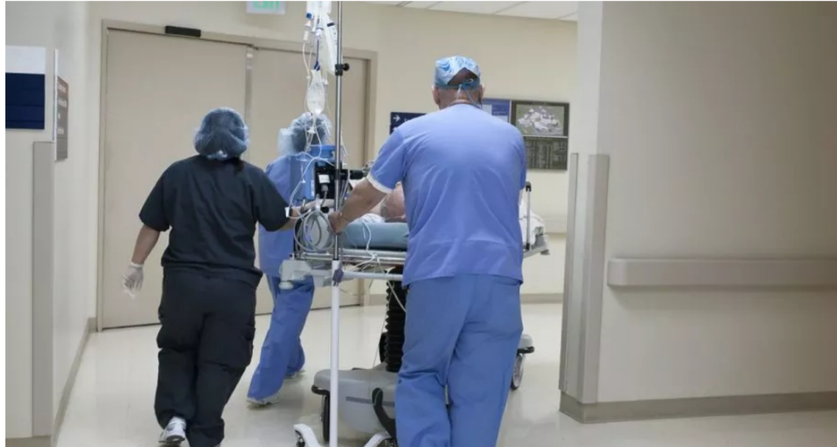
Confirman nueva muerte por coronavirus en Colombia; un hombre en Cali. | Getty Images./Imagen ilustrativa.