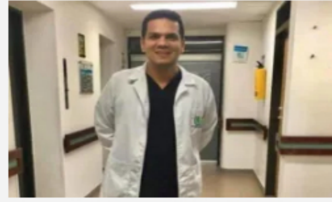
[Video] Compañeros despidieron con calle de honor al médico que murió en clínica de Bogotá