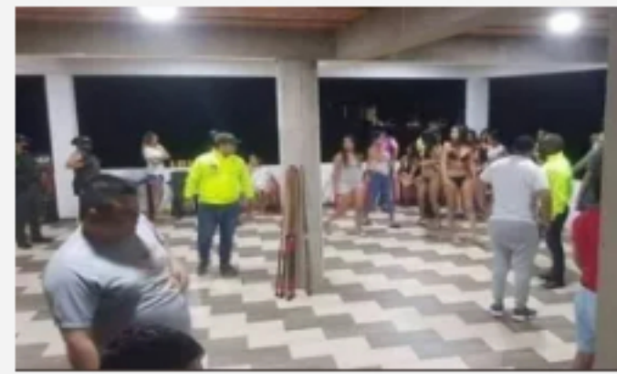
Sorprenden a 42 personas violando cuarentena en prostíbulo: festejaban con armas y drogas