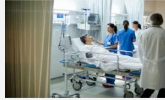
20 nuevas muertes por coronavirus en Colombia; los casos de contagio ya son 2.709