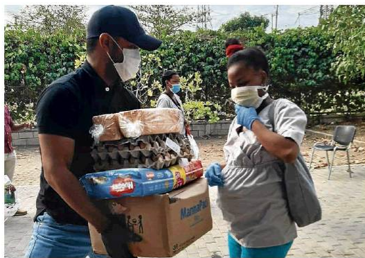
Colombia Cuida a Colombia

En el marco de la gestión realizada por todos los aliados de esta iniciativa, se han entregado entre el 30 de marzo y el 6 de abril 1,9 millones de kilos de alimentos, beneficiando a 483.723 personas en condiciones de vulnerabilidad en más de 25 ciudades y municipios del país. Estas cifras aumentan