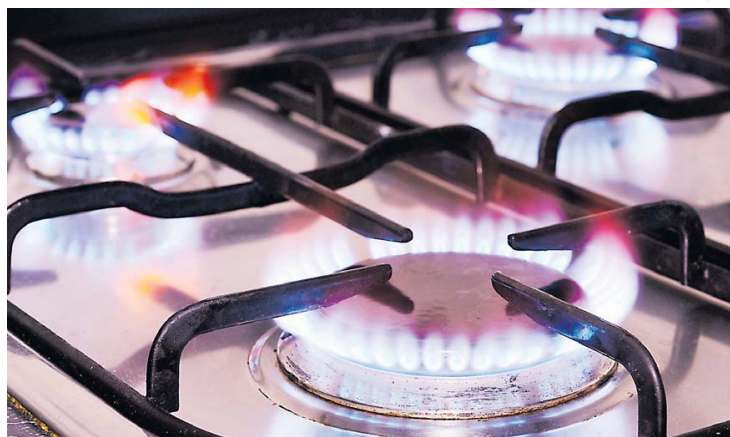
Una estufa que opera con gas natural, servicio cuyo pago se podrá diferir.

El dirigente gremial afirmó que para los usuarios de gas que no tengan la posibilidad de pagar el consumo de abril se les diferirá en 36 meses este valor.