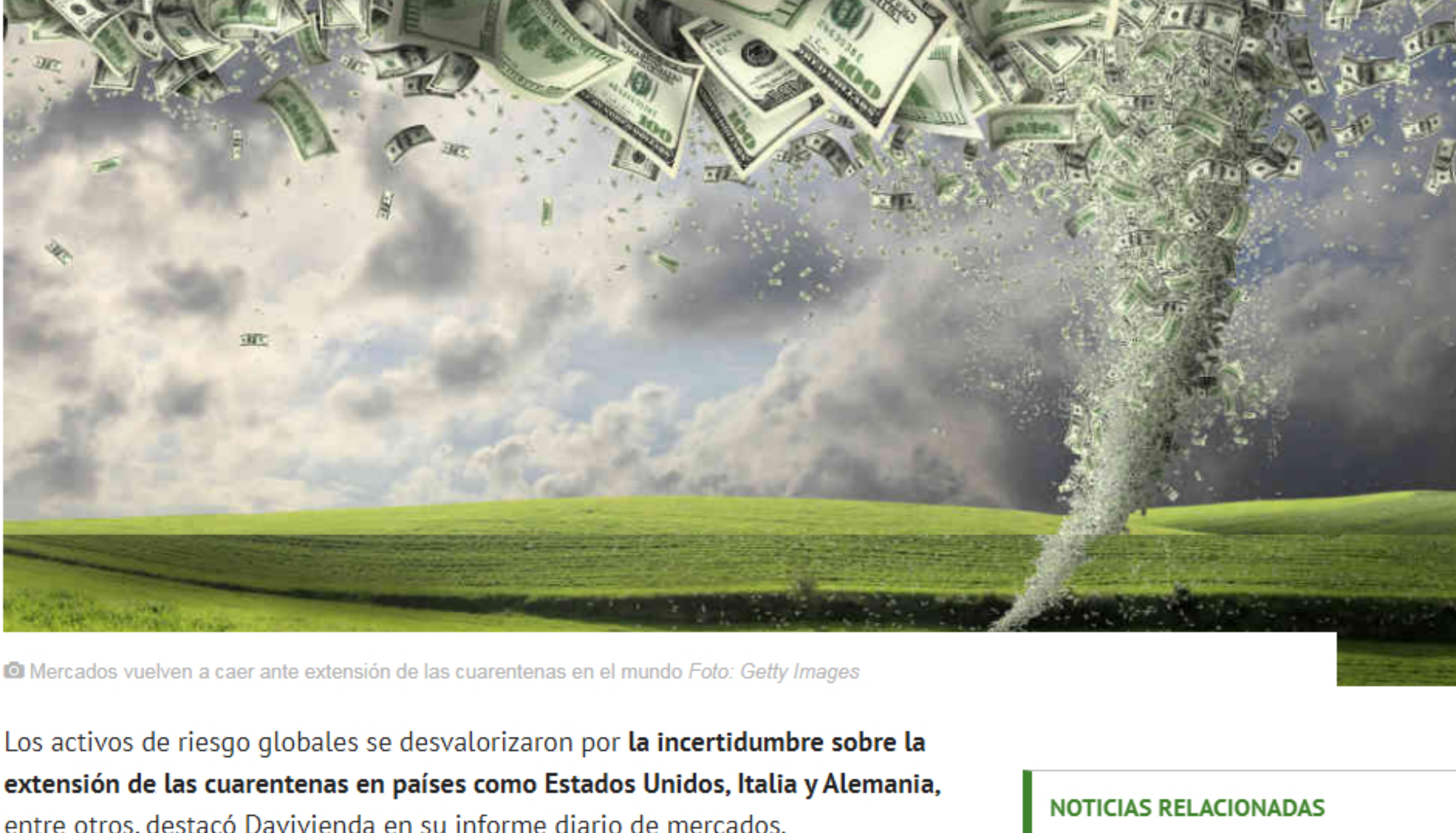
© Mercados vuelven a caer ante extensión de las cuarentenas en el mundo Foto: Getty Images

Los mercados mundiales se desvalorizaron por la incertidumbre sobre la extensión de las cuarentenas en países como Estados Unidos, Italia y Alemania, entre otros. Fitch Ratings rebajó la nota soberana de Colombia y pronosticó una caída de la economía nacional de 0,5%.