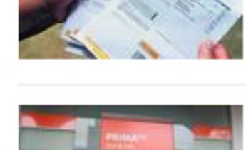
Publican decreto para retirar hasta S/2.000 de las AFP: ¿Quiénes...