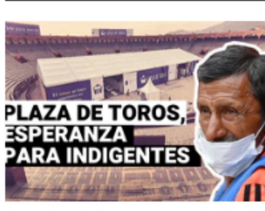
Plaza de toros se convierte en un albergue para...