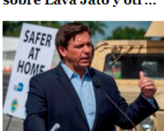
Gobernador de Florida ordena confinamiento obligatorio por...