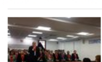
Juzgados podrán recibir casos urgentes sobre Lava Jato y otros...