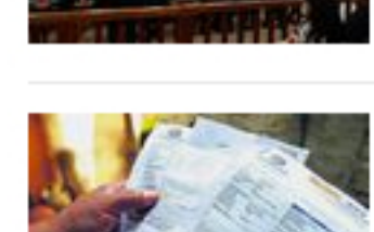
Gobierno trabaja una norma para el prorrateo de recibos de servici...