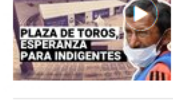
Plaza de toros se convierte en un albergue para indigentes de Lima