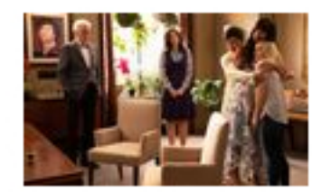
The Good Place: la serie que te obliga a reflexionar sobre tus acciones y qu...