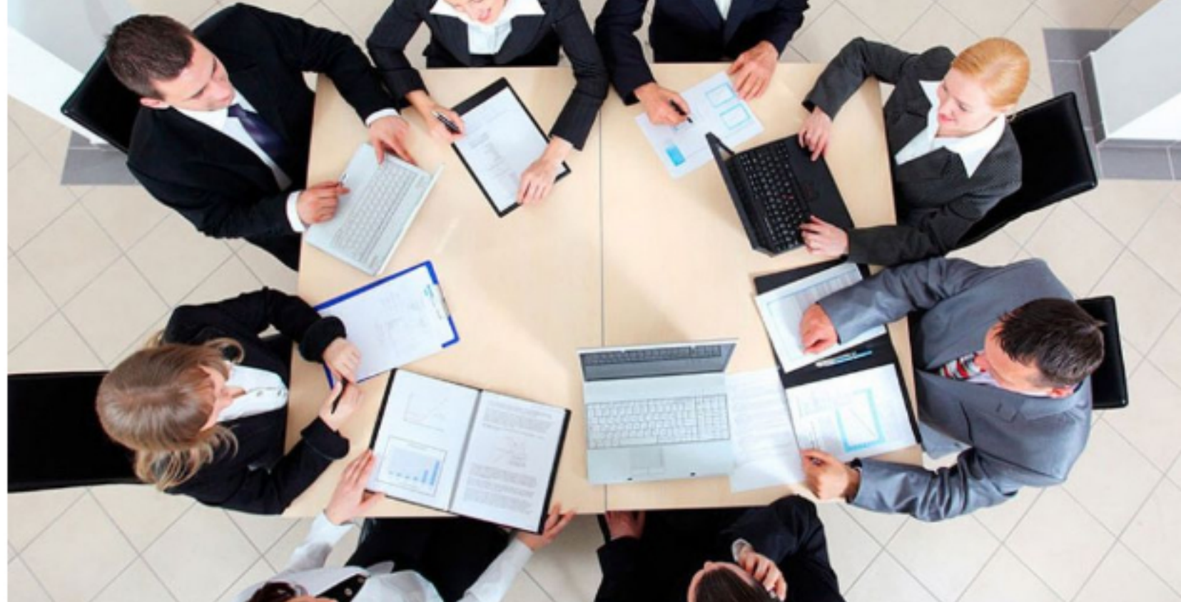
"El Covid-19 ya nos cambió: las reuniones presenciales serán la excepción y lo virtual la regla", sostiene Barclay. (Foto: Referencial)

Según la socia de estudio CMS Grau, la legislación peruana únicamente permite las reuniones virtuales en casos muy puntuales.