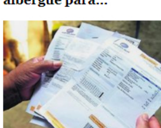
Gobierno trabaja una norma para el prorrateo de recibos ...