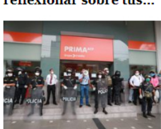
Publican decreto para retirar hasta S/2.000 de las AFP: ¿Quiénes...