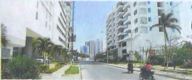
La nueva sede central de la Cámara de Comercio de Cartagena se espera daría al servicio en 2022 o 2023. En la imagen, aspecto de El Cabrero, uno de los barrios donde podría establecerse la nueva instalación de la entidad.