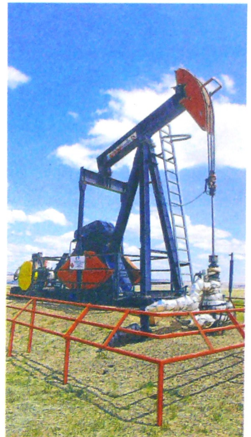
La recuperación más rápida de lo esperado de la producción de petróleo de Arabia Saudita deprimió el viernes los precios.

Durante la semana pasada, el Brent perdió 3,8%, al igual que el WTI. ☐