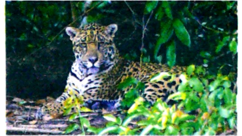
En la dimensión ambiental ISA resalta su Proyecto Conexión Jaguar.

de Conducta (94 puntos). En la dimensión social, fueron muy positivos los resultados en Talento Humano (17 puntos por encima del resultado de 2017) y Derechos Humanos. En Gestión de Comunidades se obtuvo el máximo puntaje posible (100 puntos) y la mayor calificación de la categoría de Mercados Emergentes en el Involucramiento con Grupos de Interés (97 puntos). En la dimensión ambiental, ISA alcanzó resultados notables en cambio climático (91 puntos) y biodiversidad (92 puntos), asuntos en los que mejoró su puntaje principalmente por el desarrollo de iniciativas asociadas al Proyecto Conexión Jaguar. Lo anterior