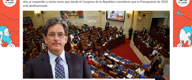
Las cuentas de Carrasquilla para 2020.

El Ministro de Hacienda explicó por qué el Gobierno considera que no va a tener presiones fiscales el próximo año, al responder a varias voces que desde el Congreso de la República consideran que el Presupuesto de 2020 está desfinanciado.