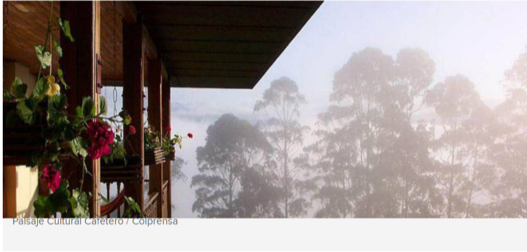
Paisaje Cultural Cafetero

La obra tuvo un costo cercano a los 81 millones de dólares.