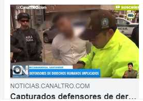
NOTICIAS.CANALTRO.COM Capturados defensores de der...

Canal TRO hace 24 minutos Dos defensores de derechos humanos fueron enviados a la cárcel como responsables del secuestro de Mayerly Santos Calderón ocurrido en Sabana de Torres. https://bit.ly/2m9OhUq