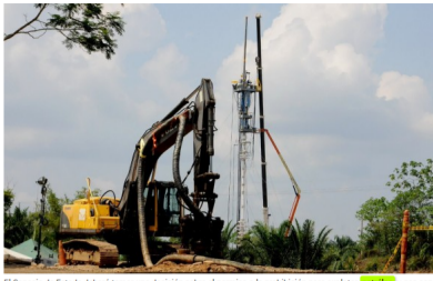
El Consejo de Estado deberá tomar una decisión sobre el permiso o la prohibición para explorar petróleo y gas con la técnica de fracking.

COLOMBIA CONSEJO DE ESTADO FRACKING MINERÍA