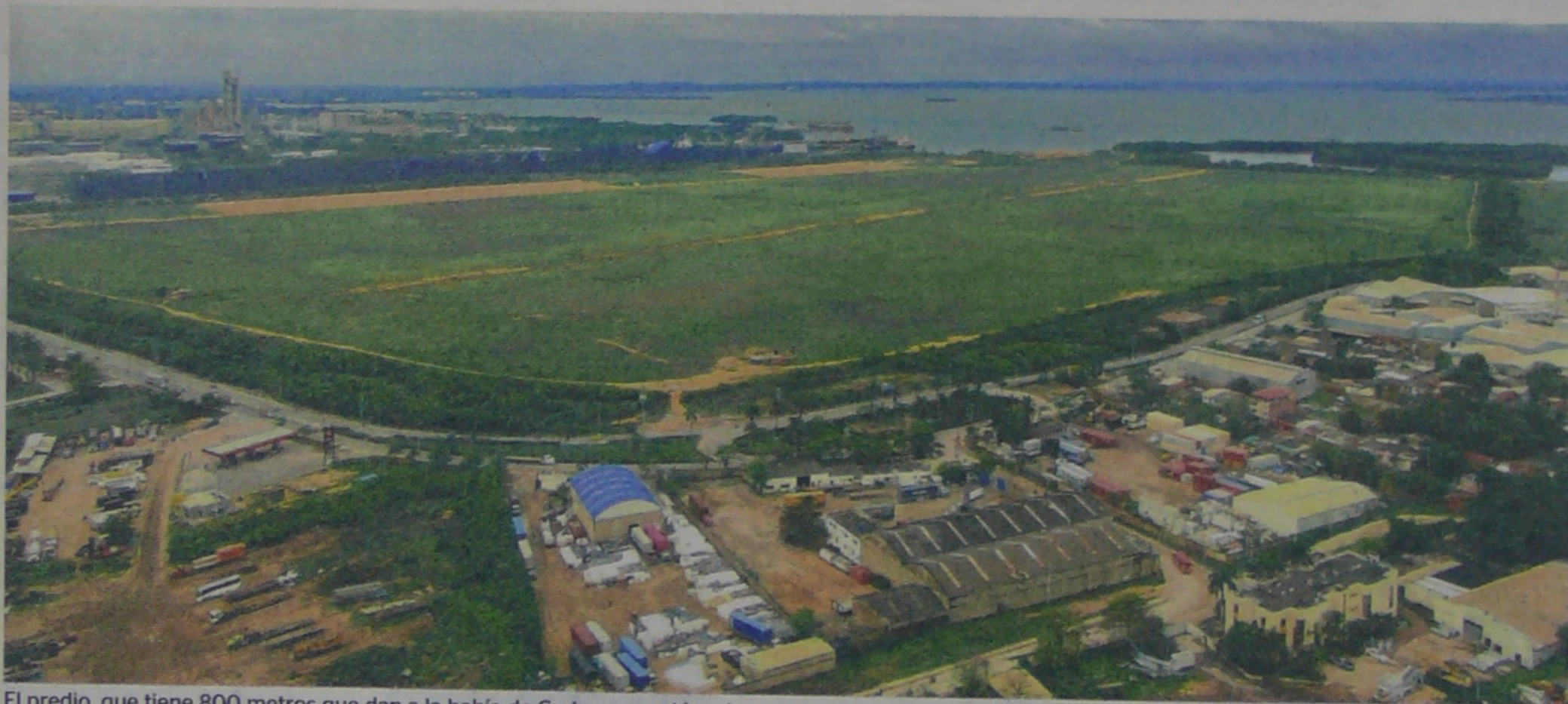
El predio, que tiene 800 metros que dan a la bahía de Cartagena, está en la zona industrial de Mamonal. La subasta sería entre diciembre y enero.

La Sociedad de Activos Especiales subastará estos bienes, entre los que está un lote de 107 hectáreas en Cartagena, avaluado en $420.000 millones. Pág. 6