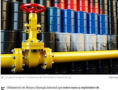
Una planta de gas en inmediaciones del mar de Kara, en Siberia (Rusia)