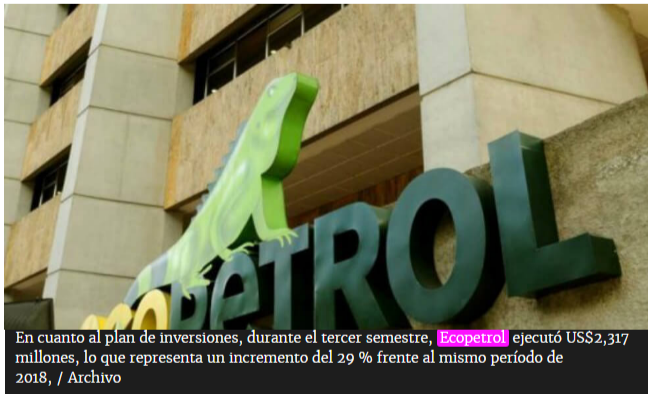
En cuanto al plan de inversiones, durante el tercer semestre, Ecopetrol ejecutó US$2,317 millones, lo que representa un incremento del 29 % frente al mismo período de 2018

Según reportó la compañía, al cierre del trimestre mantuvo una caja de $16 billones y alcanzó 723.000 barriles de petróleo equivalente por día, es decir, 8.000 barriles más frente al mismo período del año anterior.