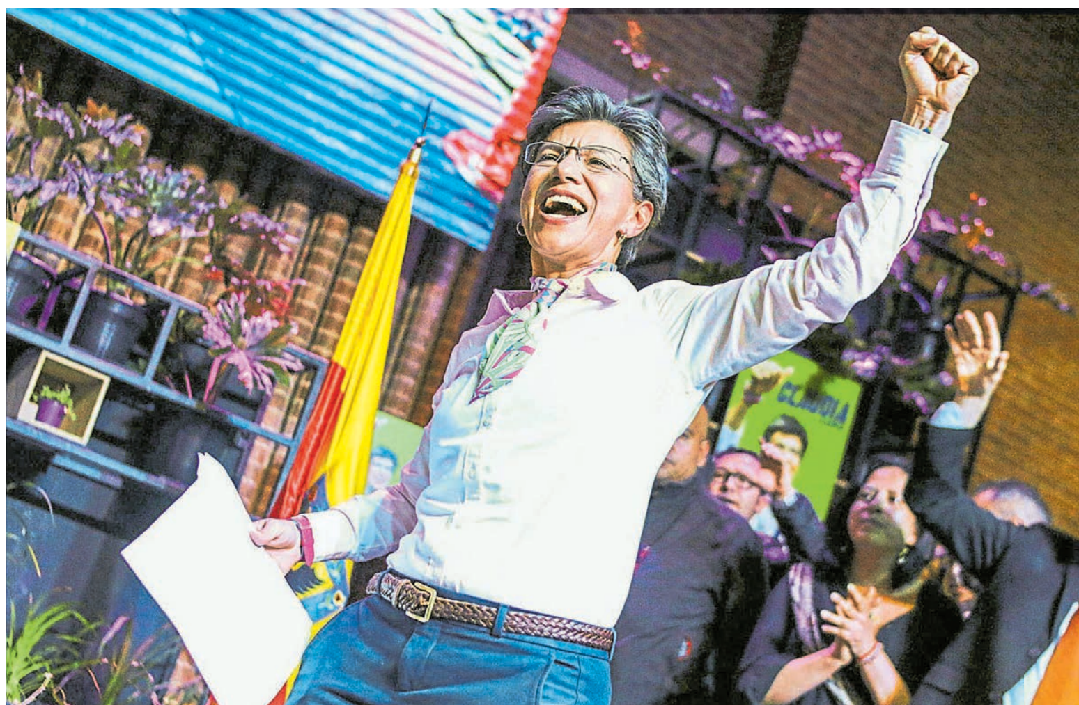
Claudia López prometió “un gobierno abierto, que escucha, que concierne y que cuida cada peso” de los ciudadanos.

Los bogotanos hicieron ayer historia al elegir por primera vez a una mujer para regir los destinos de la ciudad.