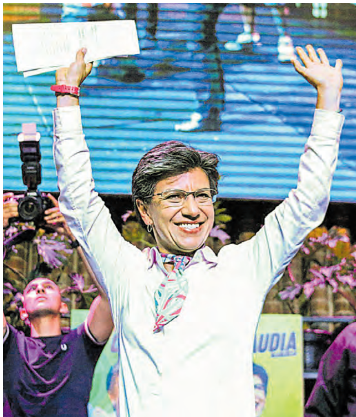
Claudia López, alcaldesa electa de Bogotá.

Con 1'108.541 votos (35,2%), la candidata de la coalición del Partido Alianza Verde y el Polo, se convirtió en la primera mujer en regir los destinos de la capital, por voto popular. Págs. 3, 4 y 5