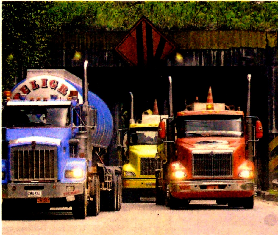
Los pequeños transportadores tienen cuatro alternativas para postularse al programa.

ños deberán desintegrar su vehículo con antigüedad igual o mayor a 20 años, este deberá tener el Soat y la Revisión Técnico Mecánica (RTM) en tres años, continuos o no, durante los últimos cinco años anteriores a la postulación.