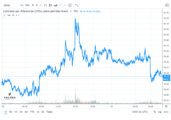
(The Wall Street Journal, Finviz, Investing, Markets insider, Ámbito, 20 minutos, Valora Analitik).

El informe semanal de la Administración de Información Energética se publica hoy y los analistas esperan que indique un aumento de 2,23 millones de barriles.