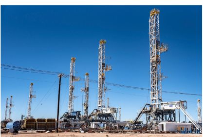
Imagen de referencia. Exploración petrolera en Odessa, Texas.

Las autoridades estadounidenses aprobaron una empresa conjunta entre las dos compañías para el desarrollo de depósitos no convencionales. Se espera que a la nueva compañía le vaya bien este año.