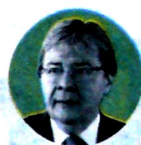
Roger Federer, tenista.

El canciller, Carlos Holmes Trujillo, representará al país en las ceremonias de entronización del emperador japonés Naruhito.