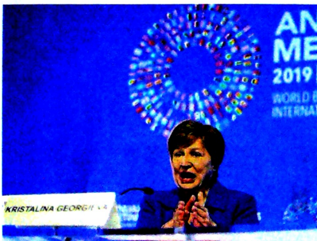
Kristalina Georgieva, nueva jefa del Fondo Monetario Internacional.

Ayer terminó reunión del organismo, el cual advirtió que la economía solo crecerá al 3 % este año. Criptomonedas, en la mira.