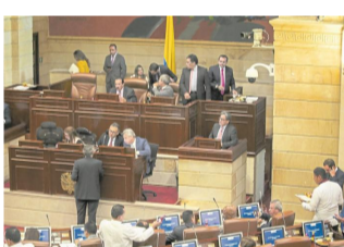
La ley de Presupuesto debe aprobarse plenamente antes del 20 de octubre próximo.