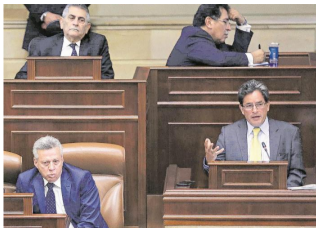
Este manejo de activos se aprobó en el Presupuesto 2020.