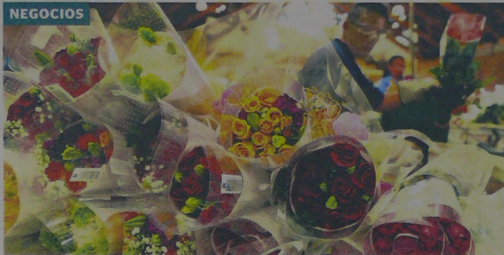
En los dos últimos años, las exportaciones de flores frescas a esa nación han aumentado 126%.