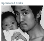
Padre e hijo toman la misma foto durante 27 años - La última te hará llorar

TRADING BLVD Foto de Jennifer Aniston sin maquillaje confirma los rumores