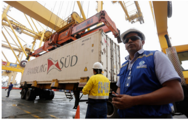
En los primeros ocho meses del año las ventas al exterior llegaron a 26.812 millones de dólares, por debajo de los 33.711 millones de dólares que sumaron las importaciones.