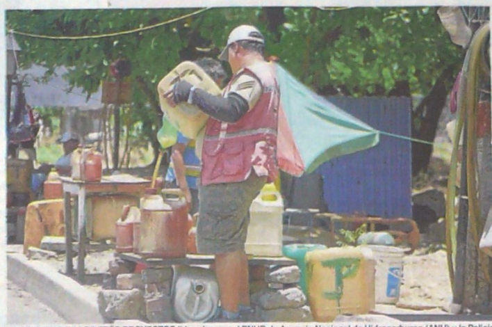
EL OBJETIVO DE LOS TRES PROYECTOS liderados por el PNUD, la Agencia Nacional de Hidrocarburos (ANH) y la Policía Nacional es incidir en los planes de vida de los vendedores informales.

secretario de Minas y Energía del departamento, señaló que los vendedores informales están prestos a participar en el avance de estos proyectos.