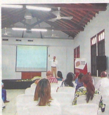
LA SEGUNDA PRESENTACIÓN de los avances del clúster de café de Norte de Santander se llevó a cabo, el martes, en la Biblioteca Pública Julio Pérez Ferrero.

De las reuniones participan el Ministerio de Comercio, Industria y Turismo y Procolombia.