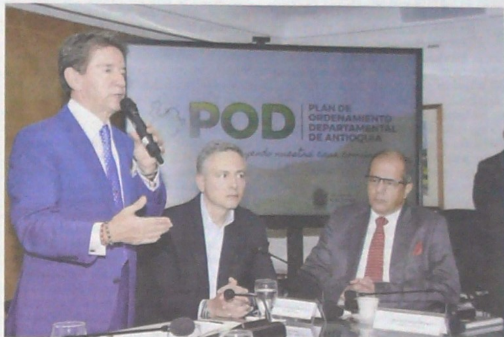
Presentación de la Ordenanza en la Asamblea Departamental de Antioquia.

Ante la aprobación que la Asamblea de Antioquia dio a la Ordenanza Plan de Ordenamiento Territorial Departamental, el pasado 2 de septiembre, EL MUNDO presenta un análisis de gremios profesionales y empresas del sector minero sobre su alcance.