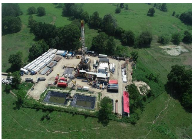
BLU Radio. Pozo Petrolero

El nuevo hallazgo petrolero fue realizado por Ecopetrol en el Por: Redacción Digital BLU Radio