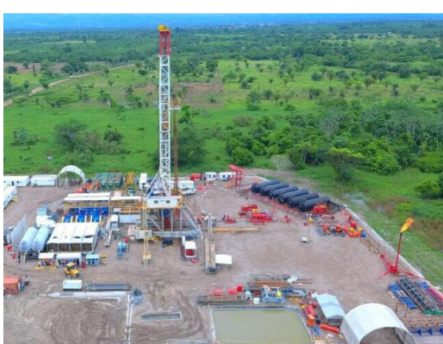
Durante las pruebas iniciales se acumularon 2.413 barriles de petróleo

E n Puerto Wilches (Santander), Ecopetrol realizó un nuevo hallazgo de crudo en la formación La Paz. El pozo está dentro del Convenio de Explotación Magdalena Medio, en el que la empresa tiene participación del 100%.