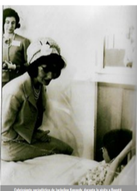
Calabrero periodista de Jacqueline Kennedy, durante la visita a Bogotá.