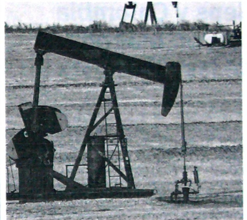
En el 2020 el país produciría 860.000 barriles por día.

“El país ha logrado mantener un nivel de producción cercano a los 900.000 barriles, pero no está garantizado a futuro. De ahí la importancia de que la reactiva-