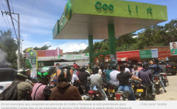
En los municipios que componen las provincias de Ocaña y Pamplona se está presentando poco combustible y largas filas en las estaciones de servicio. Esta dinámica se estaría dando los próximos de cada mes por falta de cupo.

La demanda de hidrocarburos nacionales supera a la oferta. El consumo creció 14%.