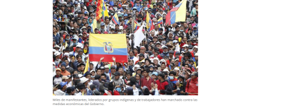
Miles de manifestantes, liderados por grupos indígenas y de trabajadores han marchado contra las medidas económicas del Gobierno.