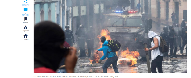
Un manifestante ondea una bandera de Ecuador en una protesta de este sábado en Quito.

RELACIONADOS: ECUADOR | MARCHAS | CRISIS | LENIN MORENO | PROTESTAS