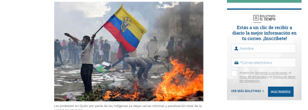
Las protestas en Quito por parte de los indígenas ya dejan varias víctimas y paralización total de la capital ecuatoriana.