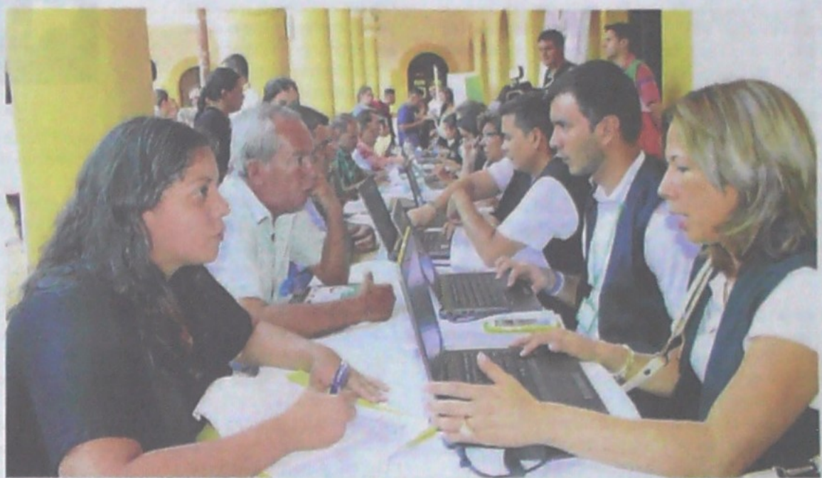
La propuesta de pagar menos del 75% del salario mínimo a los jóvenes busca disminuir la tasa de desempleo en ellos, sin embargo podría aumentarlo en otros segmentos.

trucción de vivienda, los pactos de productividad y la implementación de obras civiles que se van a realizar después de las elecciones con los recursos provenientes de las regalías.