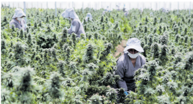
El ICA ha recibido 1.115 pedidos de registro de variedades.