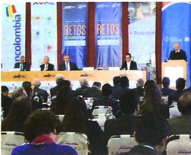
El empresario Luis Carlos Sarmiento Angulo, presidente de la junta directiva del Grupo Aval, destacó el crecimiento que está teniendo la economía, pero señaló que debe prestarse atención al desempleo.

En la asamblea de Anif, la Superintendencia Financiera indicó que el aumento del desempleo es uno de los factores que pueden incidir en los índices de morosidad de los créditos.