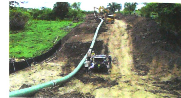
Obras del gasoducto Jobo-Majaguas, entre Córdoba y Sucre.

Según la compañía, la operación no generará endeudamiento incremental, ya que la totalidad de los recursos obtenidos se destinará