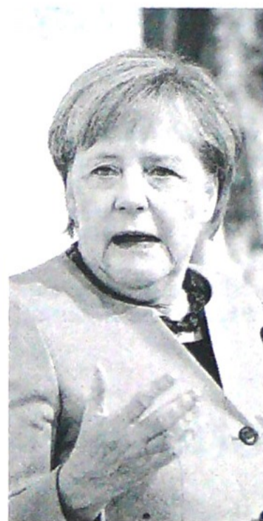
Angela Merkel, canciller de Alemania.

Un portavoz de la canciller alemana confirmó la llamada, pero se negó a hacer más comentarios. Sin embargo, Norbert Röttgen, un importante aliado político de Merkel, dijo que no hay una nueva posición de Alemania sobre el Brexit. "Francamente, un acuerdo para el 31 de octubre sobre la base de las propuestas de Johnson no ha sido realista desde el principio", dijo Röttgen. La UE, por su parte, se mostró mordaz sobre la posición de Johnson. "Boris Johnson, lo que está en juego no es ganar un estúpido juego de culpas", dijo el presidente del Consejo Europeo,