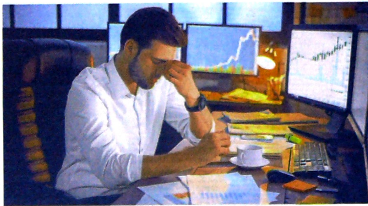
A medida que la economía crece las necesidades de financiación también lo hacen. Archivo