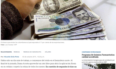
El dinero que envían los colombianos al país equivale al 17 por ciento de las exportaciones.

RELACIONADOS: REMESAS | REMESAS DE INMIGRANTES | DÓLARES