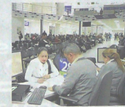
En Colombia, 8,2 millones de empleados tienen vinculación en una empresa privada y 1,7 millones en el sector público.

“Esta iniciativa abre una importante alternativa para quienes planean anticipadamente cómo financiar la educación superior de sus hijos y dependientes. Adicionalmente, ambas figuras permitirán al trabajador disponer de un recurso a futuro, según