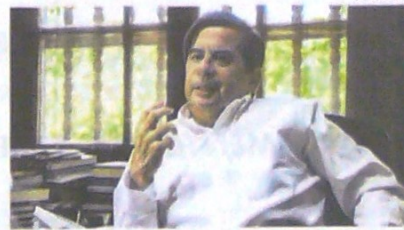
Juan Fernando Cristo, exministro del Interior.

A tres años de la derrota del plebiscito para reafirmar el Acuerdo de Paz, el exministro del Interior Juan Fernando Cristo enumeró algunos de los errores que el Gobierno Santos cometió para la garantizar la implementación del mismo, los cuales se encuentran en el libro que escribió con el exministro Guillermo Rivera 'Disparos a la Paz'. El primero, citó, fue la terna para elegir el fiscal