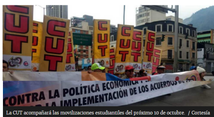
La CUT acompañará las movilizaciones estudiantiles del próximo 10 de octubre.

Ante una eventual reforma pensional y laboral propuesta por el gobierno Duque, los sindicatos laborales hacen el llamado para salir a las calles a protestar en contra de esto. Ellos se sumarán a las movilizaciones estudiantiles.