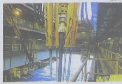
Un pozo offshore en aguas del mar Caribe.

El evento organizado por Campetrol y Merco será instalado hoy en el Country Club por el presidente de la Agencia Nacional