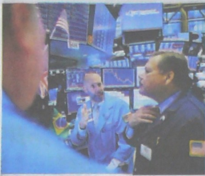
Comerciantes durante la apertura de la bolsa.

DOW JONES PERDIÓ 1,86% A 26.078,62 PUNTOS