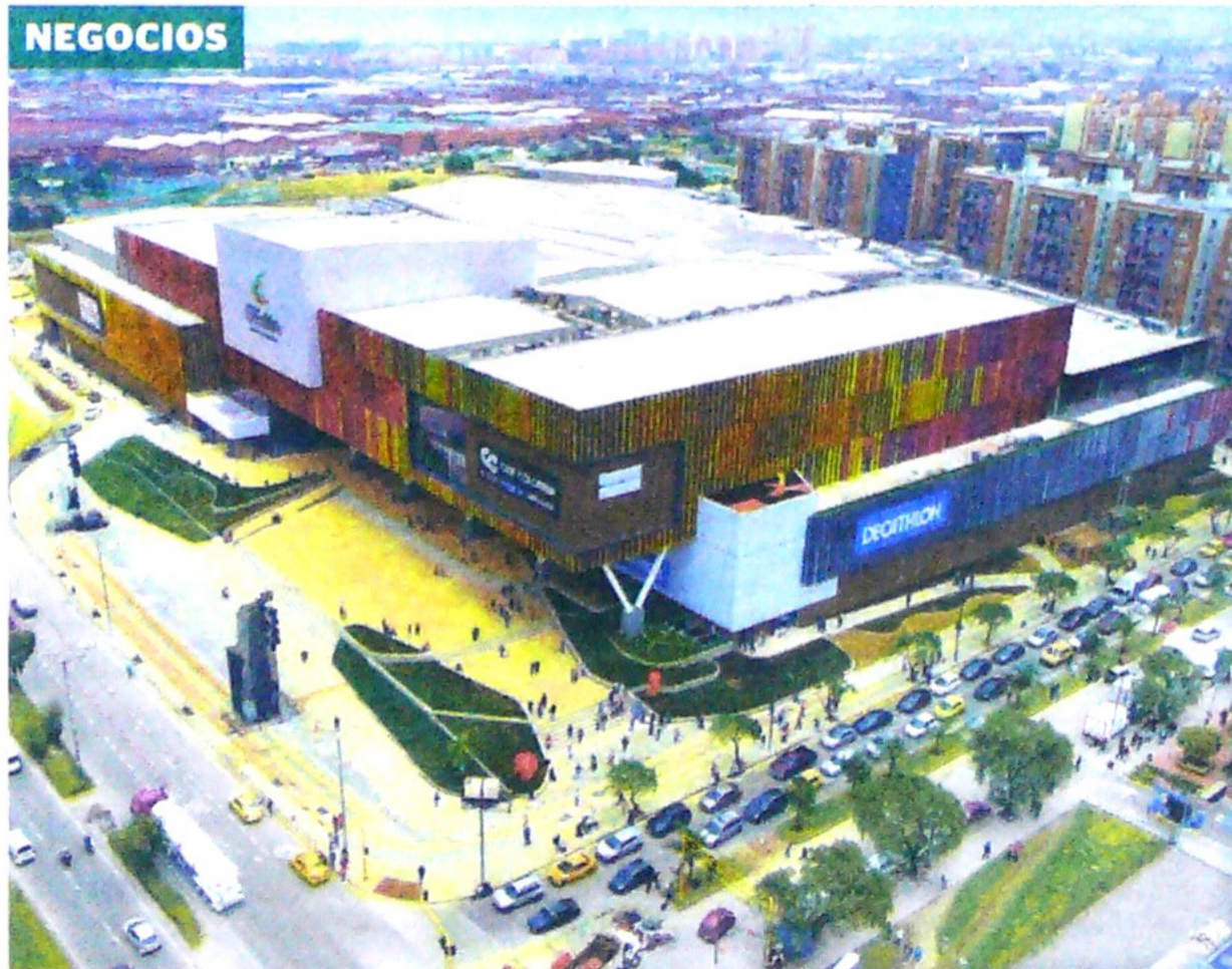
El nuevo centro comercial de Bogotá abrió ayer sus puertas al público.