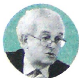
JOSÉ ANTONIO OCAMPO