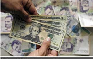
El dólar llegó por primera vez a $3.500.