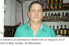
A tendero lo asesinaron dentro de su negocio en el barrio Bajo Andes, de Manizales

Para comentar debes iniciar sesión o registrarte aquí