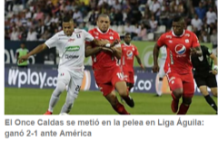
El Once Caldas se metió en la pelea en Liga Águila: ganó 2-1 ante América